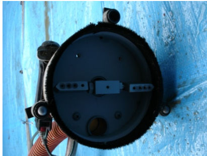
NO,2 ハンドアクアブラスト